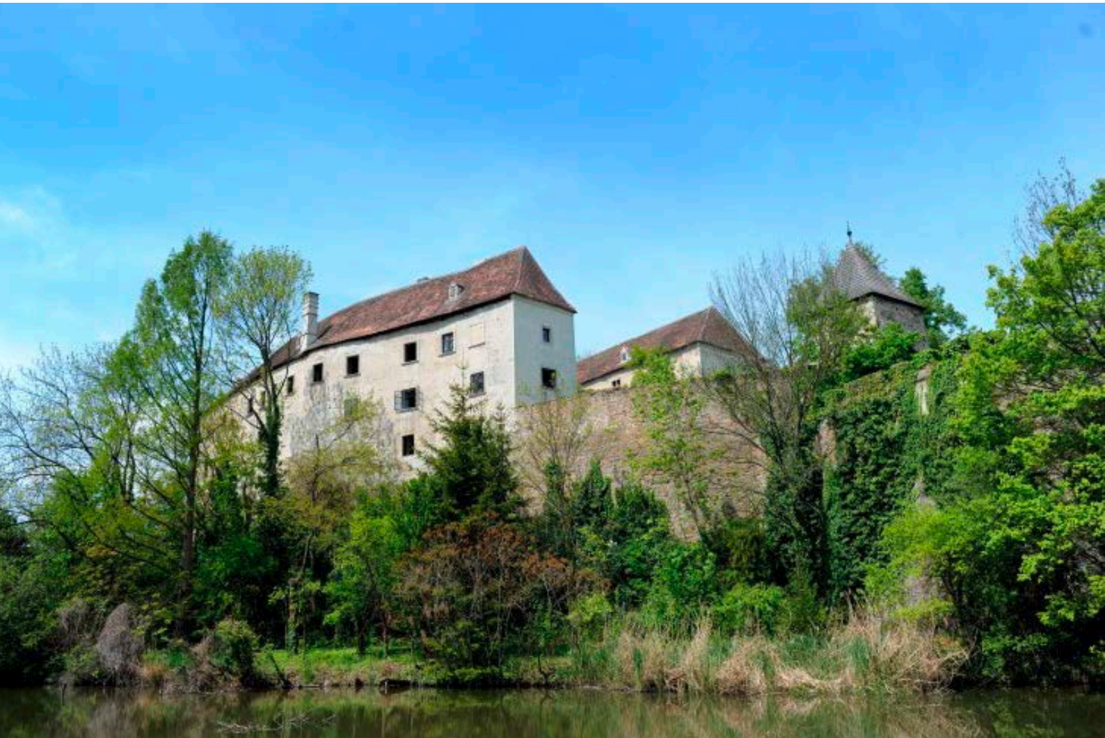
Die Burg am Wasser: wehrhaft nach außen, behaglich innen

kaum dass ein neues Möbel irgendwo aufgestellt war und sich dann wieder Wichtigerem zugewandt: Dem Aufstauen eines Baches, dem Füttern der Tiere beim Bauern oder dem Versteckspiel mit dem jüngeren Bruder.